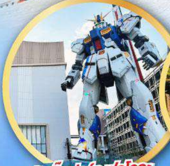
กันดั้ม ปาร์ค ฟุกุโอกะ

เดินทาง 16-20, 23-27 ม.ค. 68 06-10, 13-17 ก.พ. 68 20-24 ก.พ. 68 07-10 มี.ค. 68