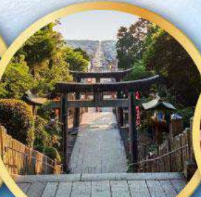
ศาลเจ้ามียาจิดากะ