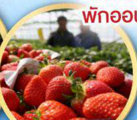
กิจกรรมเก็บสตอร์วเบอร์รี่